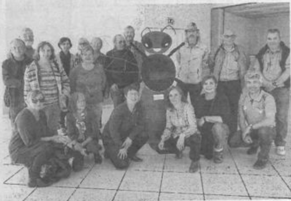
Mieux connaître le monde des abeilles dans sa diversité.

Ils ont pu échanger avec des délégués d'associations locales et apiculteurs du coin qui sont également impliqués dans cette démarche qui vise à mener des actions permettant de diffuser une meilleure connaissance de l'abeille et ce, le plus largement possible.